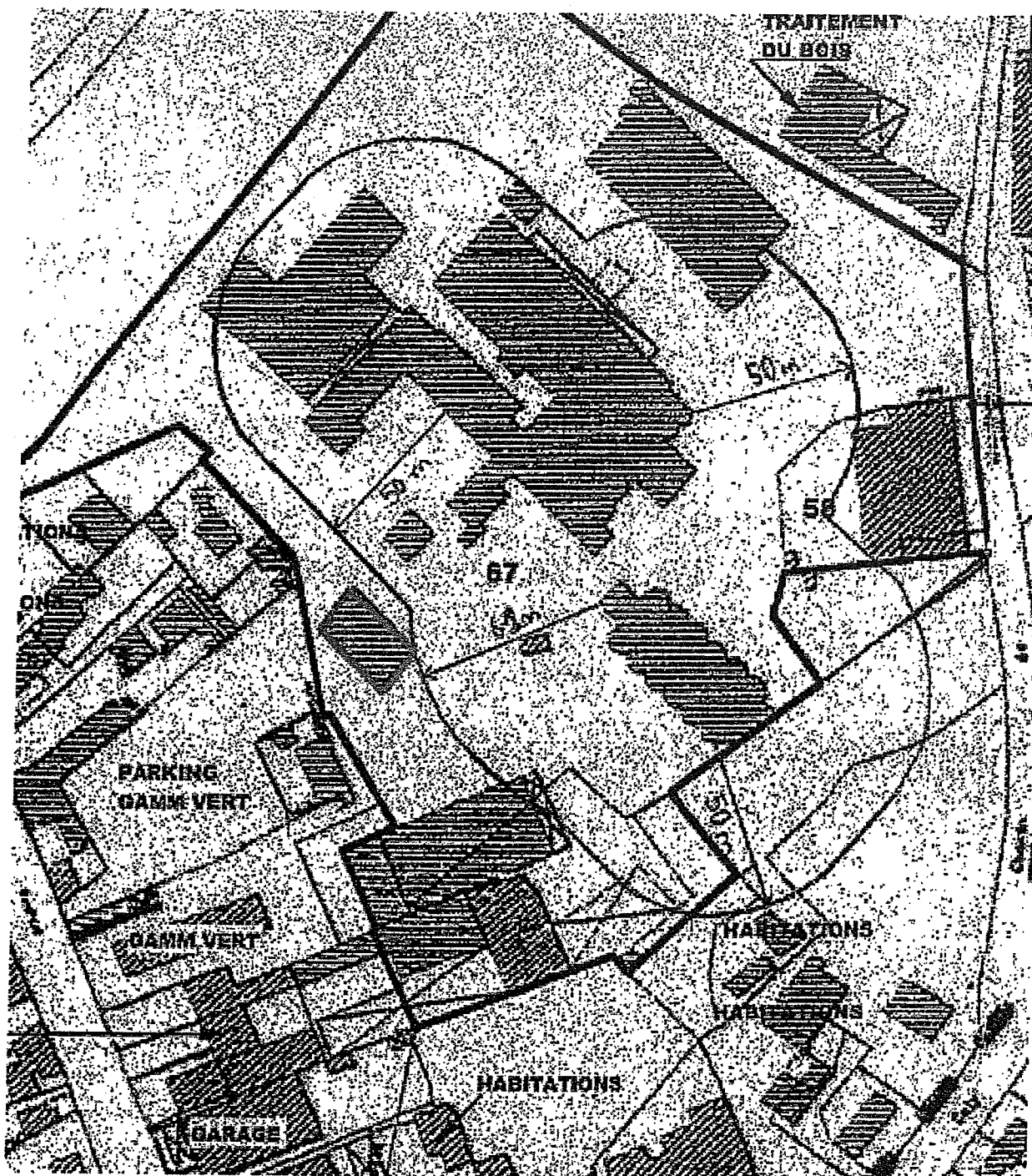
Distance d'éloignement minimale vis-à-vis des tiers (type 1)